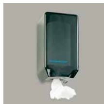
Papierrolhouder Art.nr. 100938 Navulling 9 papierrollen Art.nr. 100939