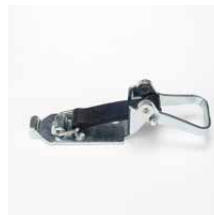
Spanvergrendeling Verzinkt staal Lengte rubberband 90 mm Art.nr. 100893