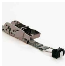
Spanband met fitting en ratelmechanisme, 1 m. Art.nr. 100979 en ratelmechanisme, 2 m. Art.nr. 10 0980