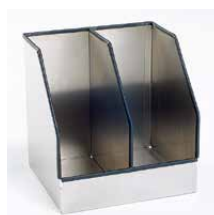
Orderhouder Aluminium, 2-vaks Art.nr. 100895