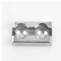
Vloeroog Geanodiseerd aluminium Art.nr. 106153