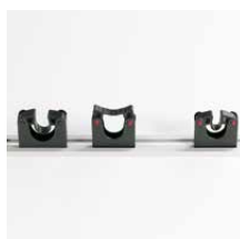
Gereedschapsklemmen Gereedschapsklem 20-30 mm Art.nr. 101048 Gereedschapsklem 30-40 mm Art.nr. 101049 Bevestigingsrail 500 mm Art.nr. 101050 Bevestigingsrail 900 mm Art.nr. 101051