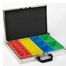
Aluminium koffer met inzetbakjes Indeling als afb. 1 Art.nr. 100921 Indeling als afb. 2 Art.nr. 100922 Indeling als afb. 3 Art.nr. 100923