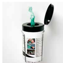
Vochtige reinigings- doekjes Inhoud 50 doekjes Art.nr. 100943 Wandhouder Art.nr. 100945