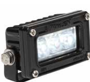
Ledwerkklamp Art.nr. 210-99-0144 1100 LUMEN 5 jaar garantie op de ledunits