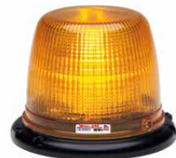
Leddaklamp ECE R65 Art.nr. 210-10-0172 optimale bedrijfsze- kerheid 5 jaar garantie op de ledunits