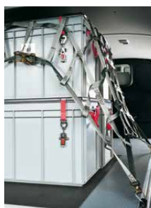
Ladingzekeringsnet 1200 x 1800 mm Rondom voorzien van bevestigingspunten voor trekbanden en haken. Art.nr. 101014