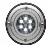
Ledinterieurverlichting Art.nr. 210-30-0307 360 lumen, aluminium basis 5 jaar garantie op de ledunits