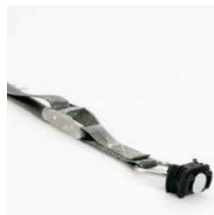
Spanband met fitting en gesp, 1 m. Art.nr. 100982 en gesp, 2 m. Art.nr. 100983