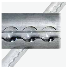
Vliegtuigrails Aluminium, 990 mm Art.nr. 100963 Aluminium, 1490 mm Art.nr. 100964