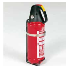
Brandblusser 2 kg Incl. wandhouder Art.nr. 100912

Kijk voor meer informatie op www.aluca.nl