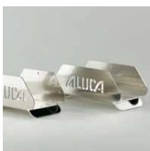
Aluminium slanghouders Slanghouder SH25 Breedte 250 mm Art.nr. 105614 Slanghouder SH32 Breedte 320 mm Art.nr. 105616