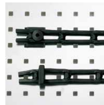
Ladderband 30 mm breed, met 2 bevestigingsdoppen, 1 m. Art.nr. 100985